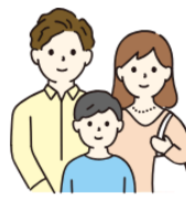
共立リゾート (リゾートホテル・ 癒しの湯宿)