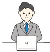
dormy inn (ビジネスホテル)