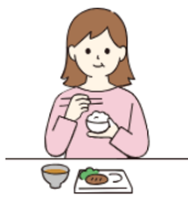
ドミール (学生寮・社員寮)

事業内容： ●寮事業（社員寮・学生寮・ドミール） （ワンルームマンションタイプ・受託寮の管理営） ●ホテル事業（ドミールイン・リゾートホテル） ●シニアライフ事業（高齢者向け在宅の管理経営）