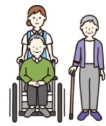
ドミールシニア (高齢者向け住宅)