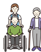
ドミールシニア (高齢者向け住宅)